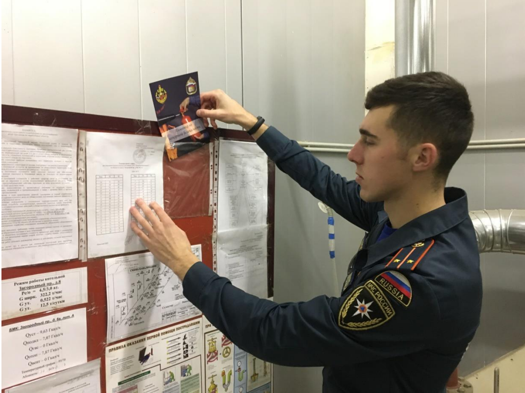
ОНДПР Центрального района 22.11.2019